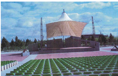
AUDITORIO PLATA Y CASTAÑAR 13 Mayo 1987

Nota: Hace tres años la feliz intervención de La Asociación Vecinal “La Incolora” de Villaverde Alto, salva al Auditorio de la “Piqueta del Partido Popular” y se parchea un poco. La Asociación tiene como objetivo su restauración para el disfrute de los vecinos.