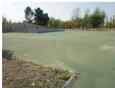
Auditorio Plata y Castañar Ahora