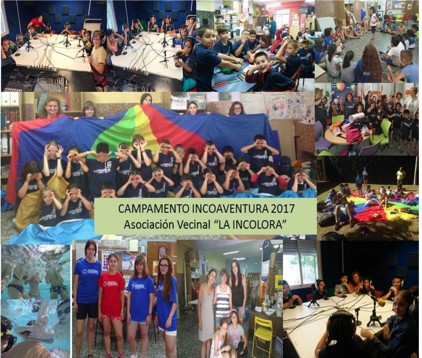
CAMPAMENTO INCOAVENTURA 2017 Asociación Vecinal "LA INCOLORA"