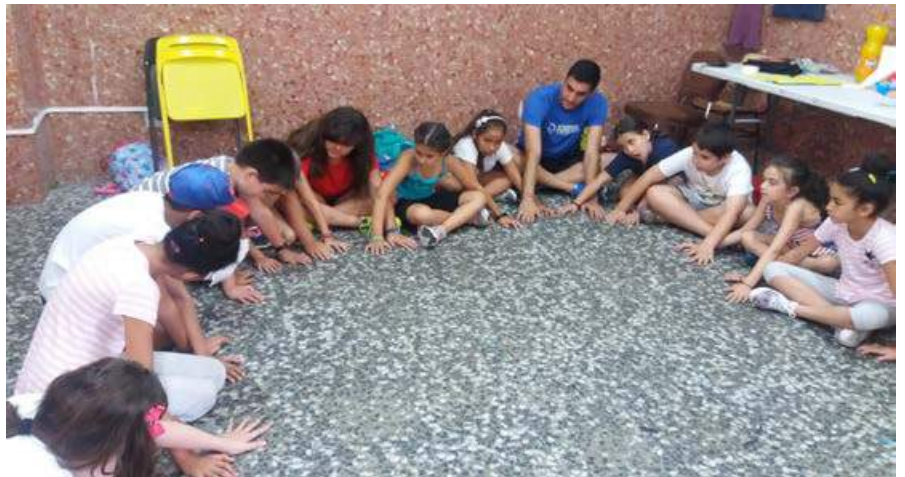
Actividades durante el campamento. INCOLORA

Estamos contando los días para que llegue el campamento de navidad y poder ver a nuestros compañeros y compañeras de nuevo.