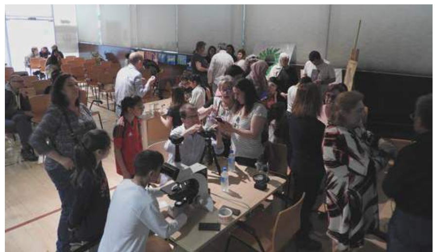
Actividades educativas en el Salón de Actos. INCOLORA

hasta la madrugada. Qué decir de las actividades que durante todo el año ofrece nuestra Biblioteca, campamentos urbanos en las épocas estivales, proyecciones de cine, exposiciones gráficas, clubes de lectura, conciertos de música de diferentes instrumentos (tales como flauta y guitarra, violín y clarinete, etc), conferencias y mesas redondas, exposiciones bibliográficas, Talleres.