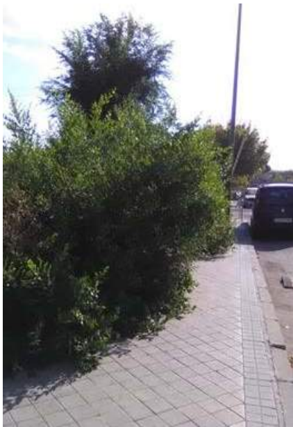
Vegetación ocupando aceras. INCOLORA

“... un Barrio que no se cuida institucionalmente propicia que la gente no lo mantenga.”