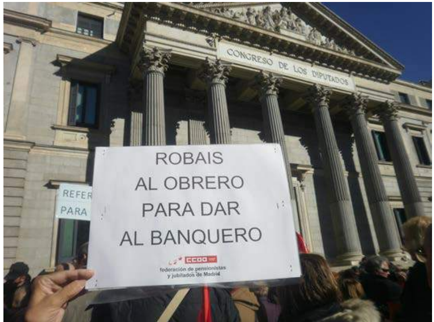
Concentración de jubilados ante el Congreso de los Diputados. INCOLORA

Hacemos un llamamiento a esos jubilados que, por unas u otras razones, no han podido asistir para que recapaciten y piensen que su presencia es necesaria y participen en las próximas manifestaciones que se harán hasta conseguir que por Ley las pensiones estén vinculadas como mínimo al IPC y su importe garantizado.