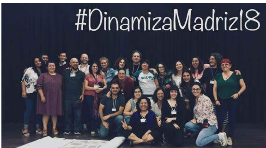
Junto al resto de miembros de los SDV, nuestras dinamizadoras actuales y pasadas. FRAVM