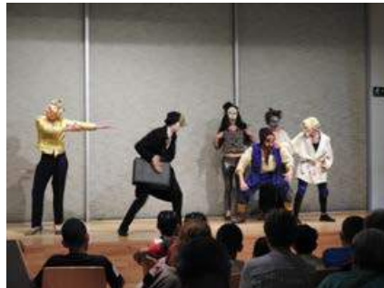
Teatro en la biblioteca. INCOLORA

muy amplia. Es lugar de estudio para los jóvenes estudiantes, que a lo largo de todo el año hacen uso del espacio de estudio que ofrece la misma, de su acceso a internet y de los préstamos de los libros que necesitan para su formación, y qué decir ya en las épocas de exámenes, donde la Biblioteca ofrece unos horarios increíbles, con aperturas extraordinarias