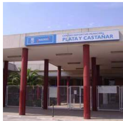
Entrada del Polideportivo. INCOLORA

dades no mencionadas, pásate por la taquilla del Polideportivo o llama al teléfono 915051532.