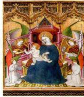
Virgen con el Niño. Tabla central del Retablo de la Vida de la Virgen y de San Francisco. Museo Nacional del Prado, Madrid.

Se podrá participar comprando décimos o papeletas, incluyendo en ambos casos un peque-