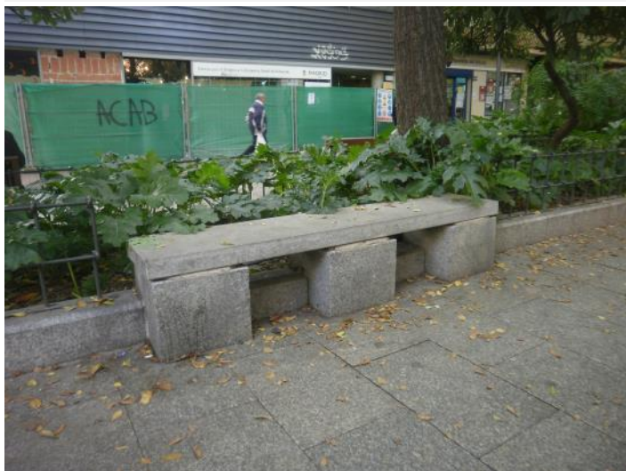
Banco sin respaldo en P.º Alberto Palacios. INCOLORA

P.º Alberto Palacios N.º 1 al 15 (Rejillas sumidero) (12)