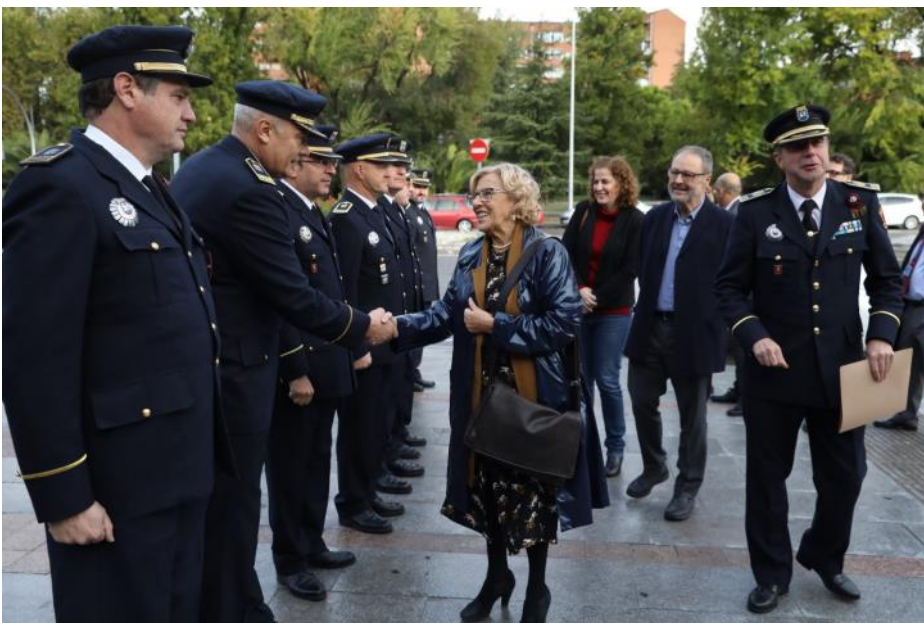
La Alcaldesa recibida, a bombo y platillo, para la presentación del Plan Especial de Seguridad.