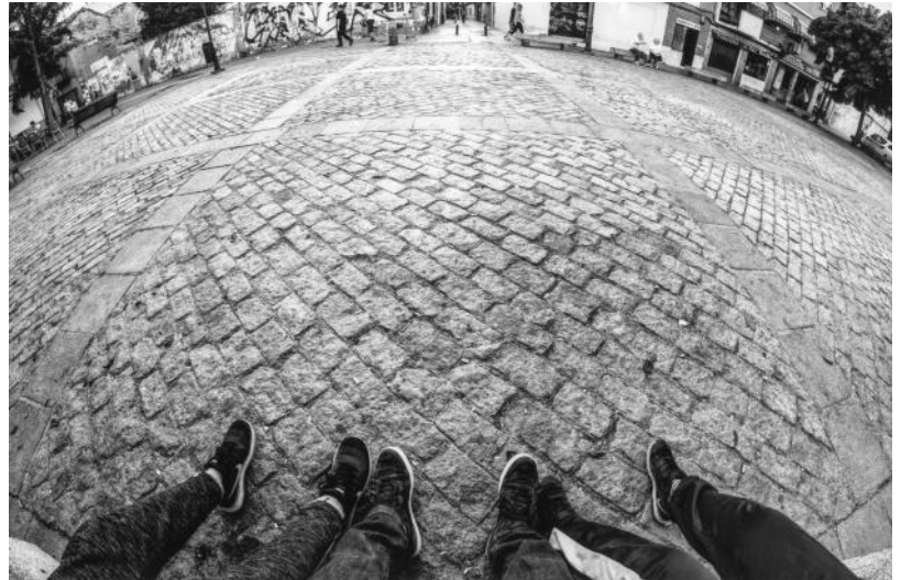
Villaverde, lugares de encuentro

Las fotografías participantes estarán expuestas, durante la primera quincena de diciembre, en el Centro Sociocultural Ágata.