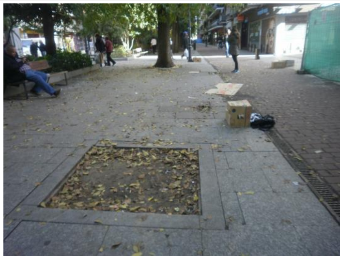
Alcorque vacío y suciedad en P.º Alberto Palacios. INCOLORA