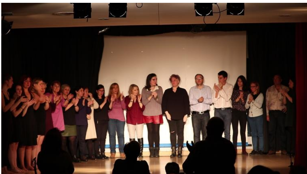
"Grupo de Teatro La Incolora" y "La Mordaza Teatro" reciben los aplausos del público. INCOLORA

Nuevo éxito de público, el aforo una vez más completo en el Centro Sociocultural Ágata, con un evento para sensibilizar a todos contra este tipo de violencia.