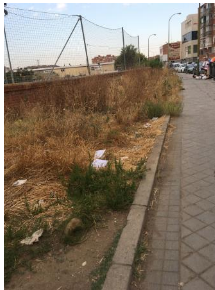
Abandono durante años. INCOLORA

Desde aquí queremos agradecer que en ambas ocasiones todos los grupos políticos votasen a favor de la propuesta y agradecer sobre todo que se haya ejecutado, aunque sea casi al final de legislatura, por la actual Junta Municipal de Villaverde de Ahora Madrid".