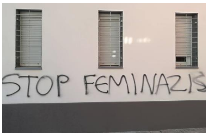
Fachada del Espacio Compartido en V. Bajo. LA UNIDAD