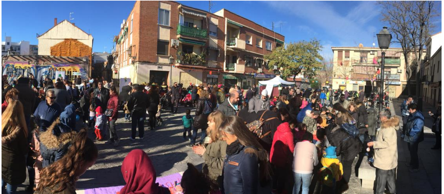
Fiesta Navideña 2017 en la Plaza Mayor de Villaverde. INCOLORA