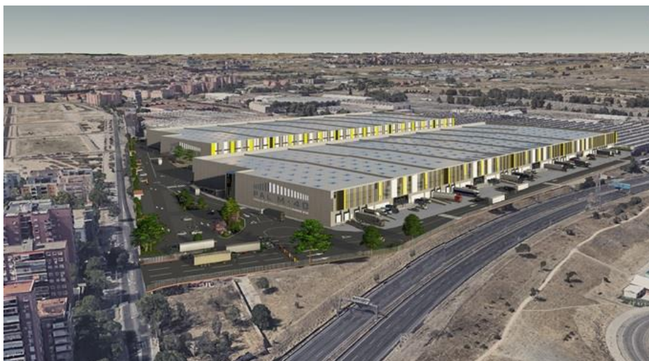
Próxima plataforma logística en Eduardo Barreiros. OBSERVATORIO INMOBILIARIO

Se están recogiendo firmas en https://www.change.org/p/ministerio-de-fomento-construcción-accesos-desde-m-40-a-la-pal-m-40-de-villaverde