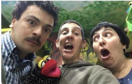
Grupo Teatral IMPROSUR

Contaremos, como en años anteriores, con la presencia de Carteros Reales y Papá Noel que, con su buzón colorido, recogerán todas las ilusiones plasmadas en una carta.