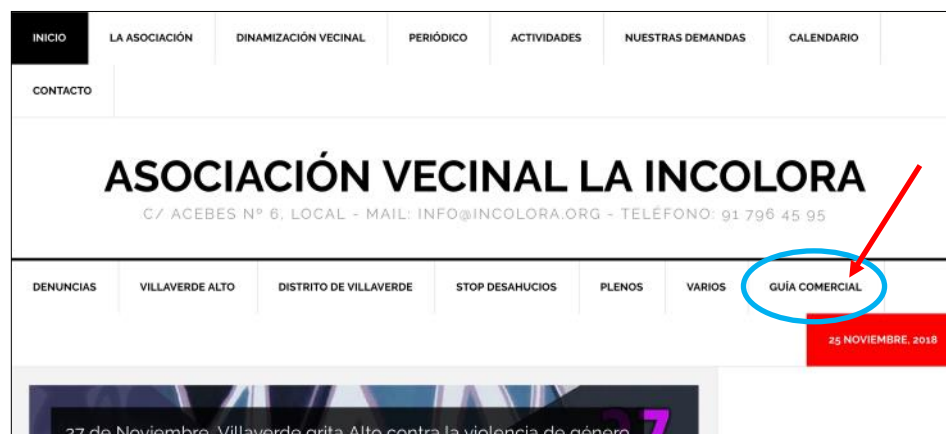
Acceso a la Guía Comercial en la web de La Incolora

Comerciante, si deseas estar en la Guía Comercial, ponte en contacto con nosotros.