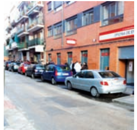
Imagen de la Oficina del INEM en la calle Salsipuedes... escogieron bien el nombre de la calle para ponerla...