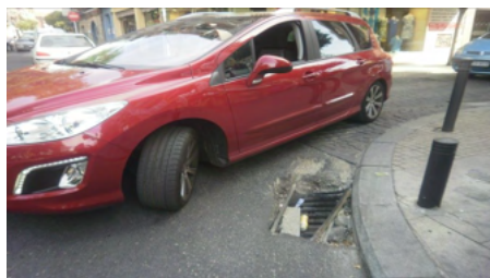
Foto de denuncia de una vecina Plaza Ágata/ Doctor Pérez Domínguez