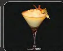
CÓCTEL CANELA ICE