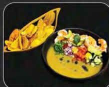
CEVICHE JIPI JAPA

COMIDA ECUATORIANA, PERUANA, COLOMBIANA Y ESPAÑOLA DELICIOSAMENTE FUSIONADA