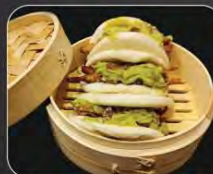
HORNADO EN PAN BAO