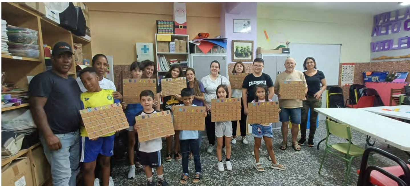
Participantes con los trabajos creados en el taller sorpresa del 8 de septiembre

¡Esperamos verte pronto en uno de nuestros emocionantes talleres!