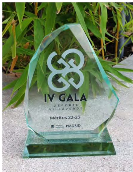
Mención entregada al Club Atletismo Villaverde

La gala fue breve pero intensa. Pasamos un rato muy agradable viendo como se hacía entrega de trofeos a los campeones de los Juegos Deportivos Municipales en el distrito que se habían clasificado para las fases finales de Madrid, así como a los campeones y subcampeones de la Copa Primavera de fútbol sala. Disfrutamos realmente viendo a los niños y niñas subiéndose al escenario y recoger sus premios. ¡Con qué soltura y confianza en sí mismos recogían los trofeos y los levantaban como si de la Champions League se tratara! Mucho más mérito que la Champions League puesto que, es el resultado del esfuerzo, del trabajo y del