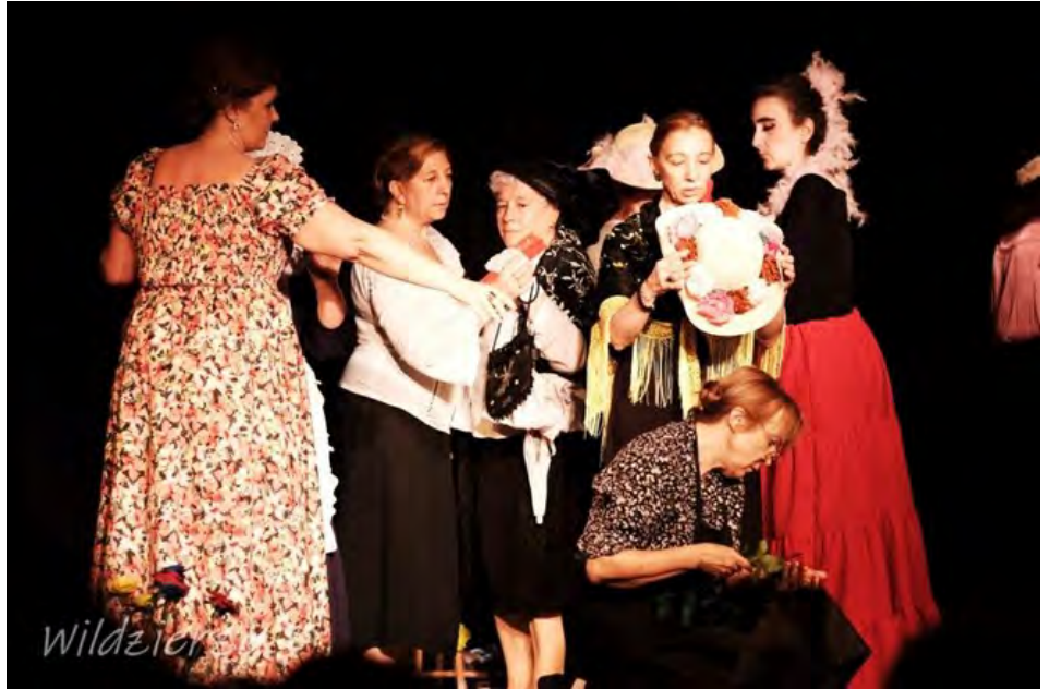
Escena de “Doña Rosita la soltera o el lenguaje de las flores”.