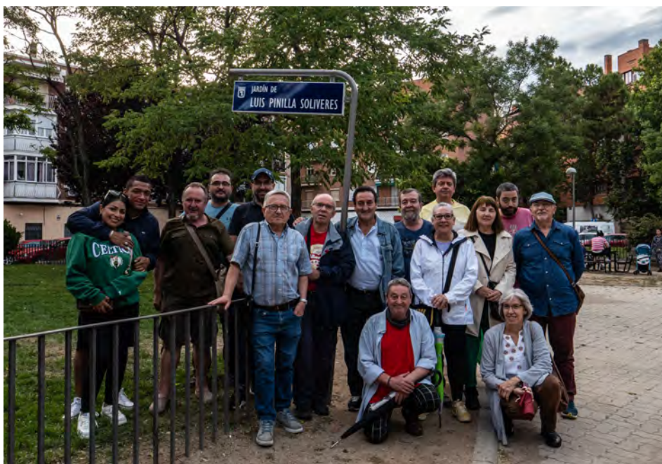
Miembros de la Fundación Luis Pinilla y La Incolora junto a la nueva placa en el parque

En 2001 sufre una enfermedad progresiva hasta su fallecimiento, ejemplar y sereno, el 7 de mayo de 2004. La sociedad pierde un buen educador de jóvenes, colectivo al que dedicó gran parte de su vida, y a la vez pierde un buen vecino.