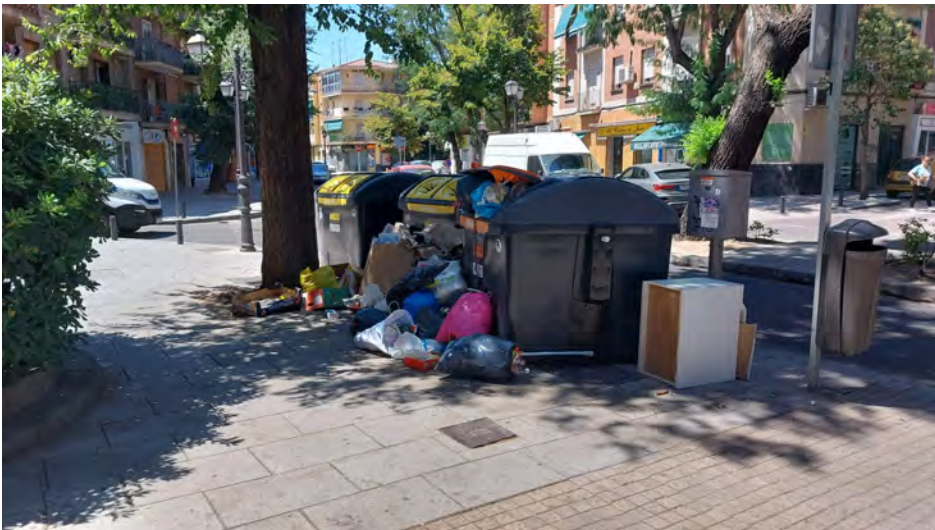
Contenedores saturados en C/ Dr. Martín Arévalo.

que en nuestro lote, que agrupa Carabanchel, Usera y Villaverde se destinan 262 millones, es decir 53 y 21, respectivamente menos, de euros, dándose la paradoja que en nuestro lote la superficie a limpiar es casi tres veces más grande y tenemos más población .